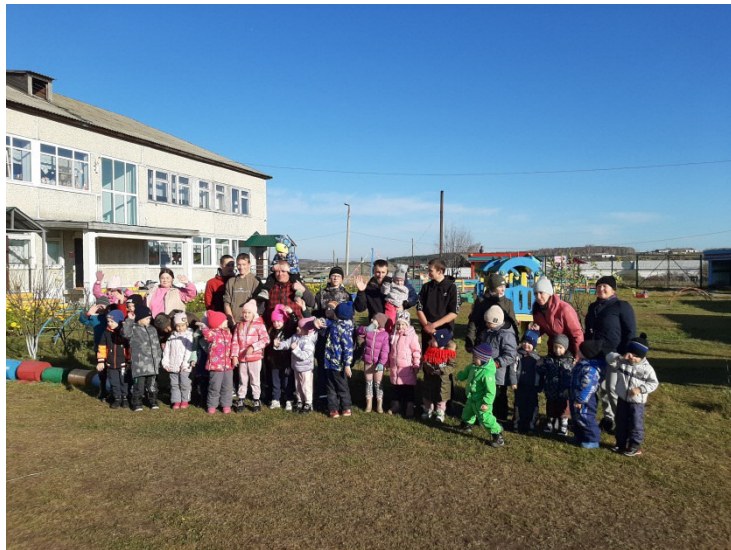
Спортивный праздник «Папа лучший друг!»