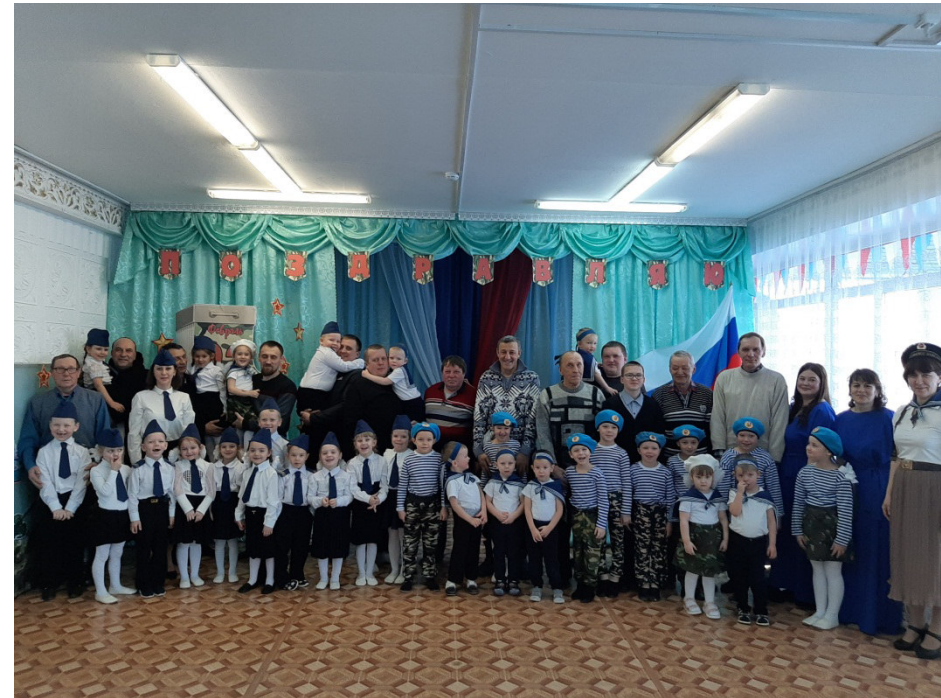
«День защитника Отечества»