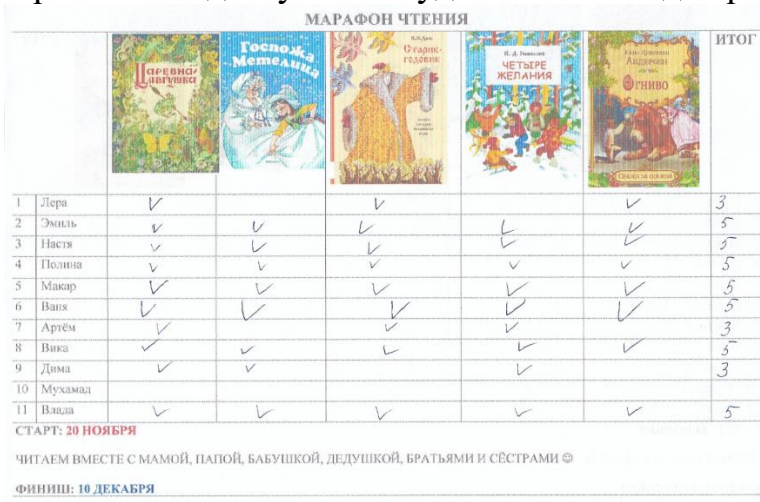
Рисунок 1: Таблица для отметок «Марафон чтения»

Семьям воспитанников предлагается поучаствовать в «Марафоне чтения». Информация про марафон со списком произведений и их авторами для каждого марафона отправляется в общий чат группы в мессенджер. Для того, чтобы зафиксировать количество прочитанных произведений родителями с детьми, была разработана таблица (рисунок 1). В таблице слева располагается колонка с именами детей, сверху в колонках – обложки книг тех произведений, которые предложены в рамках проведения одного марафона (обычно это 5-6 книг). В конце таблицы отмечены даты начала и окончания проведения «Марафона чтения» («старт» и «финиш»). Таблица располагается в приёмной в доступном и удобном месте для родителей.