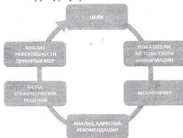
Структура управленческого цикла

Таким образом, результаты анализа ВСОКО выявляют эффективность принятых управленческих решений и комплекса мер, направленных на совершенствование системы оценки качества образования, что приводит к корректировке имеющихся и/или постановке новых целей по оценке качества образования.