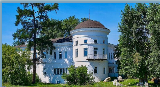
Музей «Самоцветная полоса Урала»

Муниципальное автономное дошкольное образовательное учреждение «Детский сад № 33 «Золотой петушок»