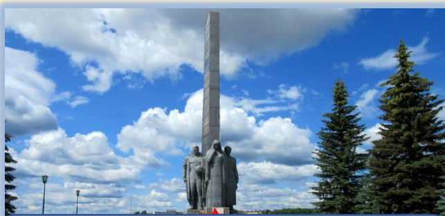
Монумент боевой и трудовой славы Режевлян