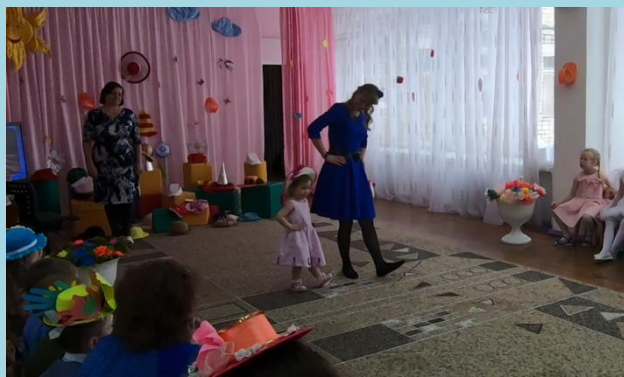
Фестиваль: «Все дело в шляпе»

Имидж ДОО – это образ дошкольной организации в целом, социально-психологическую сущность которого можно определить понятием «коллектив».