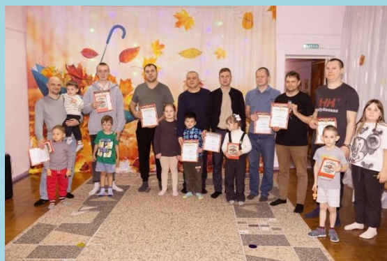
КВЕСТ «Посвященный дня Пап»