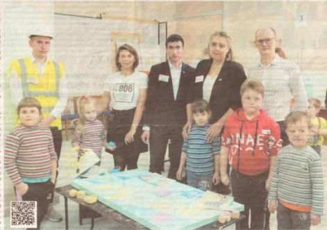
Посмотреть, как прошла экскурсия, вы можете, скачав QR-код.

Равнодушным дошколята не остались. Они проявили интерес к работе мастера. В процессе работы они узнали, что такое политехникум, зачем он нужен, какие работы выполняются в нем. Дети узнали, что такое политехникум, зачем он нужен, какие работы выполняются в нем. Дети узнали, что такое политехникум, зачем он нужен, какие работы выполняются в нем.