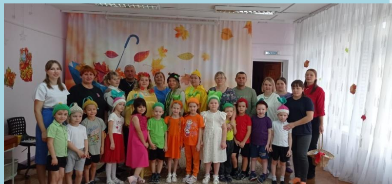
Праздник «Осень золотая»