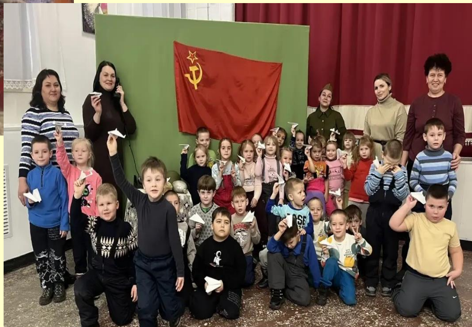
Центр культуры и искусств