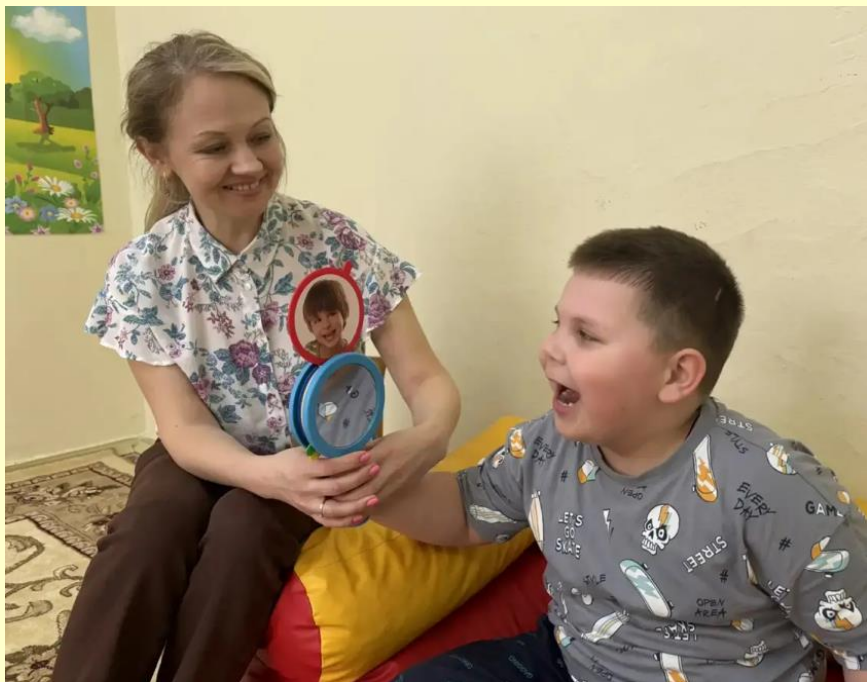
Педагог - психолог