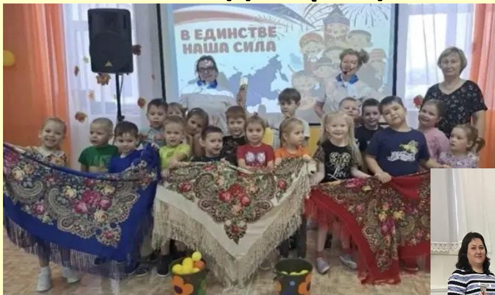
Центр Национальных культур