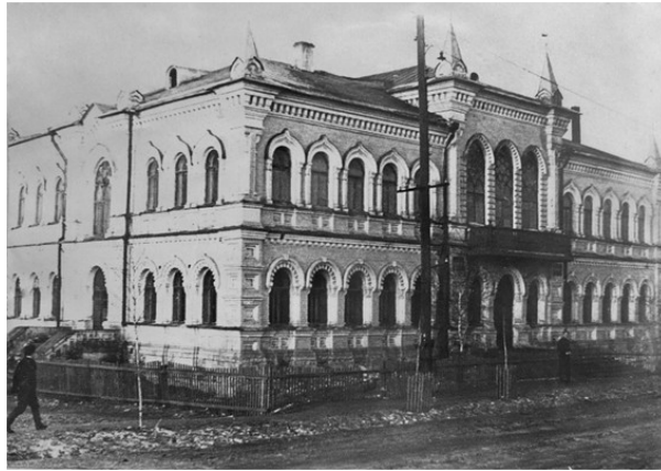
Медицинские сестры госпиталя 3106

палат, самая большая из которых занимала актовый зал на втором этаже. Корпус №2 находился в здании ул. Береговая, 3 (ныне Пушкина). Корпус №3 занимал тогда одноэтажное здание школы №5 на углу улиц 1-я Северная (ныне Большевиков) и Ленина.