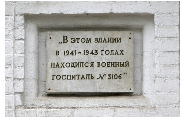
Мемориальная доска госпиталю 3106 на фасаде Режевской школы №1