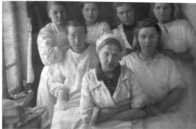
Корпус №1 госпиталя 3106

Госпиталь был рассчитан на 400 больных, но в нем на излечении находилось до 2 тысяч человек. Коллектив был укомплектован медицинскими работниками из других городов, но младший персонал в основном состоял из местных жителей. Оставались служить в нем и быв-