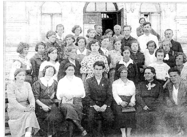
Выпуск 1939 года